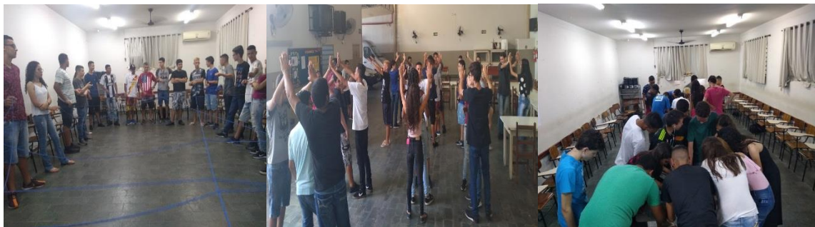
Trabalhando Relações Humanas (04/12/2019 e 06/12/2019)