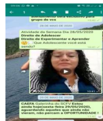
At. Ref. Adolescência (28/05/2020)