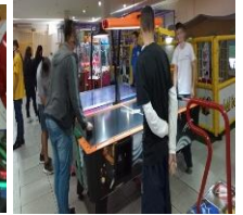
Entretenimento e Socialização (03/06/2022)