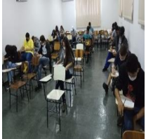
Projeto de Vida (01/06/2022)