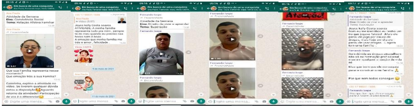
At. Ref. Relação Afetiva Familiar (04/05/2021)