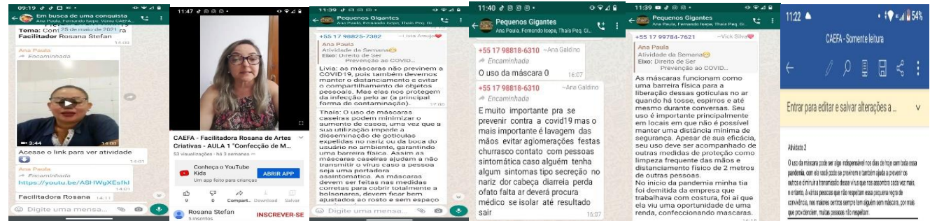
At. Ref. Confeção de máscaras (25/05/2021)