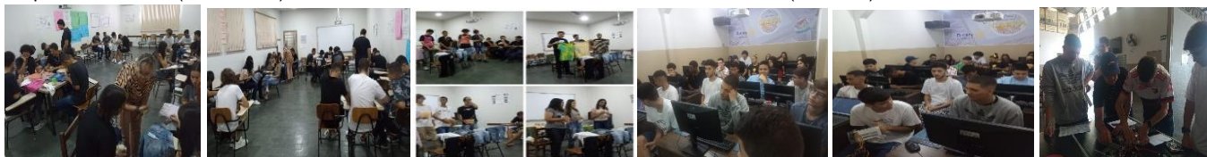
Sustentabilidade e Exposição do conteúdo (15/02/2023)