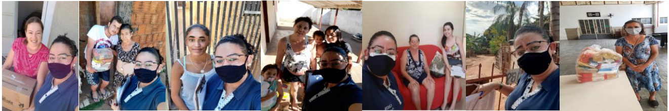
Visita Domiciliar (Ações do Covid) 01/06/2021 a 30/06/2021