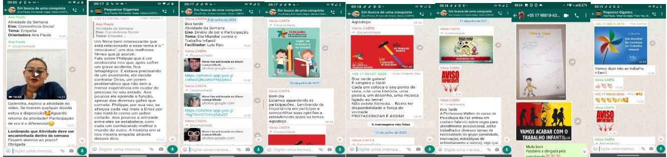
At. Ref. Empatia (01/06/2021)