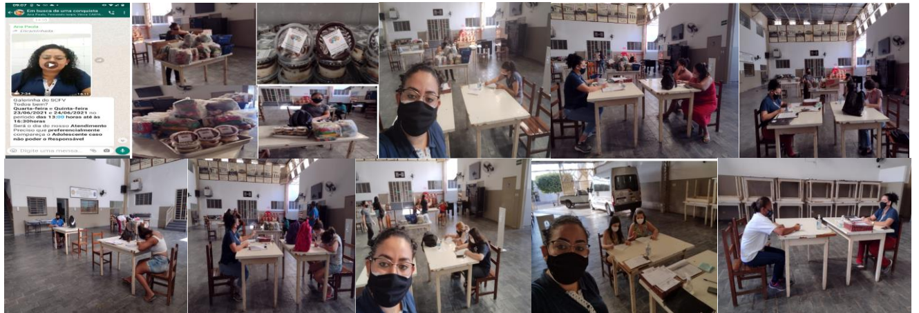
At. Ref. Atendimento Particularizado (23 e 24/06/2021)