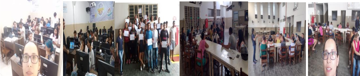
Revisão e Encerramento (27/11/2023)