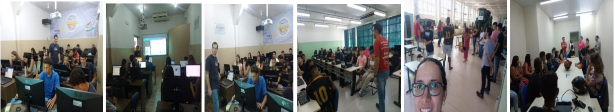
Microsoft PowerPoint e Design Gráfico (08/11/2023)