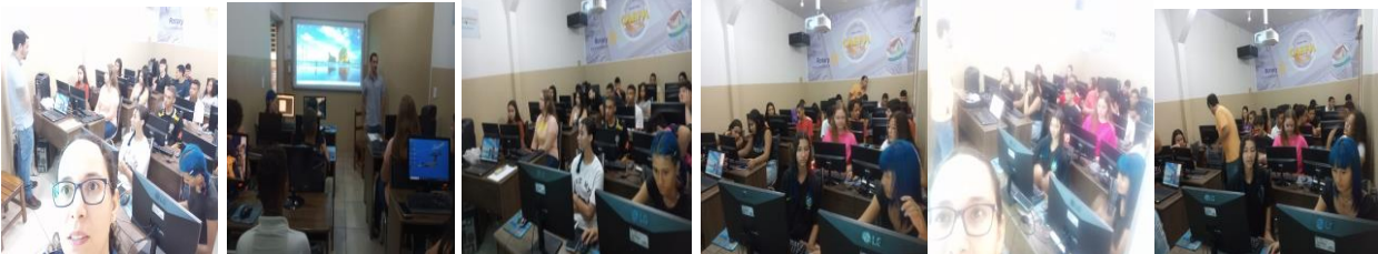
Informática Básica - Microsoft Excel (01/11/2023)